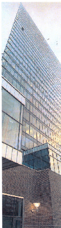
GRÖNT INITIATIV. Vasakronan, som bland annat äger Kista Science Tower i norra Stockholm, tar initiativ till ett nytt råd för grönt byggande.

Totalt 14 länder samverkar inom World Green Building Council. Syftet är att öka takten för hållbart byggande.